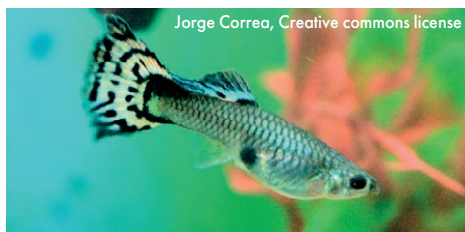
Jorge Correa, Creative commons license

Наночастицы обладают уникальными физико-химическими свойствами, высокой проникающей способностью и большой площадью поверхности, что делает их потенциально опасными при попадании в окружающую среду. К их воздействию, по расчетам специалистов, наиболее чувствительны водные организмы. Сотрудники Института проблем экологии и эволюции им. А.Н. Северцова РАН и МГУ имени М.В. Ломоносова исследовали кратковременное влияние частиц гидратированного диоксида олова размером 27 нм на рыбок гуппи. Оказалось, что наночастицы попадают из воды в организм гуппи. Судя по высокому содержанию олова в жабрах и кишечнике, они проникают именно через эти органы. Независимо от путей поступления в организм, наночастицы диоксида олова попадали в кровоток, о чем свидетельствует их значительное содержание в селезенке. В краткосрочных тестах наночастицы не оказывали на рыб выраженных токсических эффектов и не влияли на частоту хромосомных повреждений. Иными словами, проведенные исследования не позволяют считать наночастицы диоксида олова сильнодействующим токсином. Следующий этап исследования – наблюдение рыбок при длительном контакте с этим материалом. ■